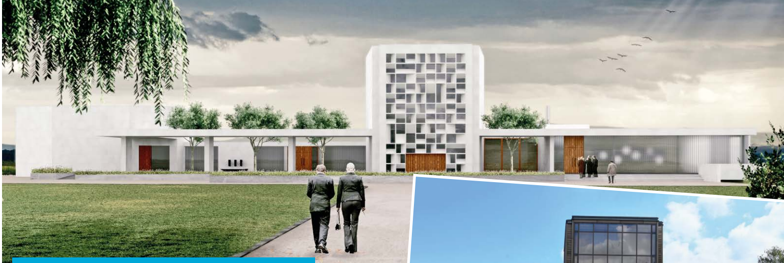
Budoucí podoba krematoria ve Slezské Ostravě.