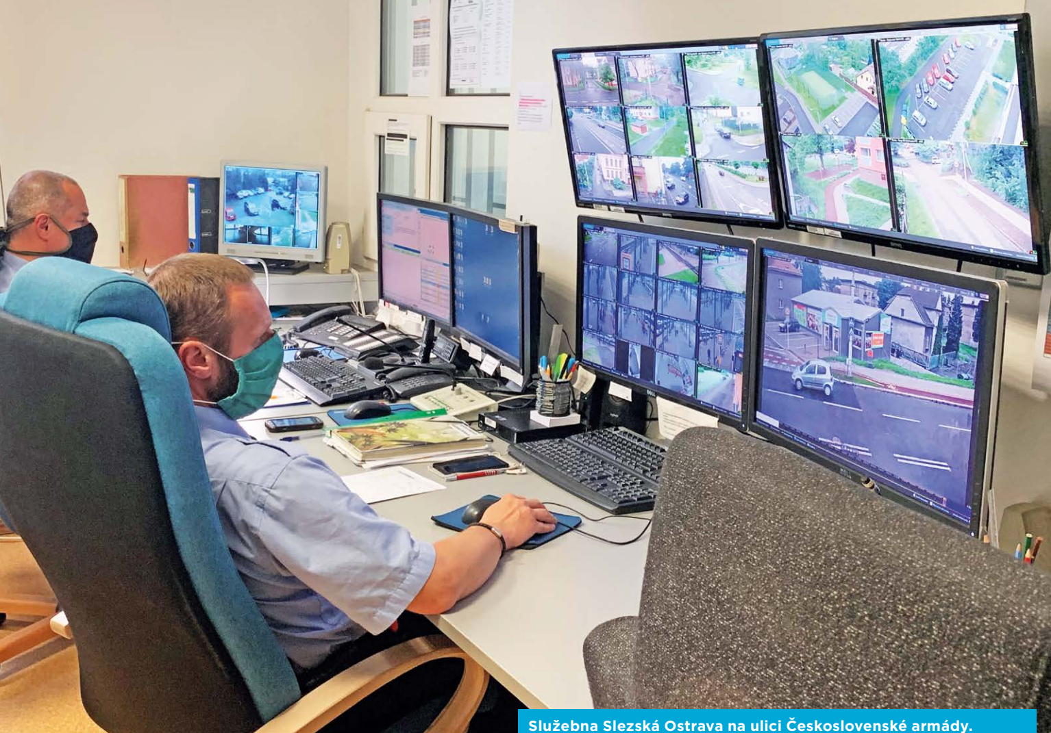
Služebna Slezská Ostrava na ulici Československé armády. Strážníci monitorují dění ve vybraných lokalitách.