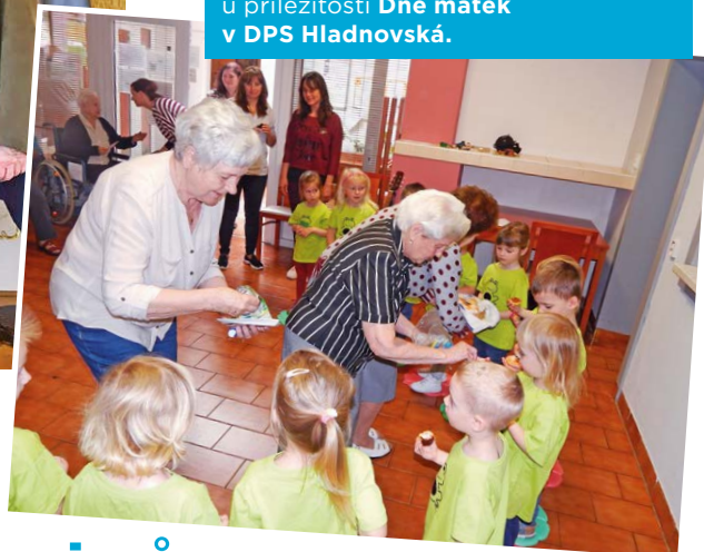
Pravidelné mezigenerační setkání u příležitosti Dne matek v DPS Hladnovská.