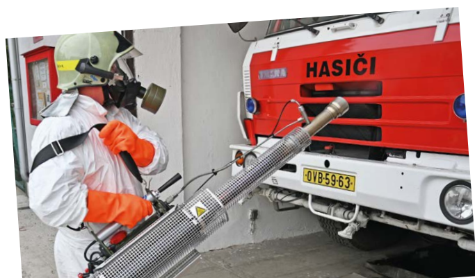
Dezinfekce v Kunčičkách. Hasiči testují novou techniku, která slouží k potírání virů.