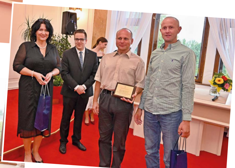
Ocenění pro společnost ISSA CZECH.