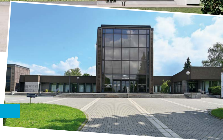
Současný stav budovy je nevyhovující.