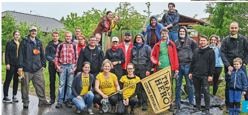
Závěrečné foto po práci.